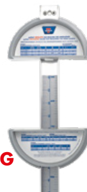
optibelt MEASURING GAUGE