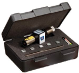
optibelt LASER POINTER II

Surely, you are aware of the importance of a correct installation as well as a regular check and maintenance of V-belts, timing belts, kraftbands and V-ribbed belts. Therefore, Optibelt offers you various useful and thought-out tools which ensure an optimum tension and alignment, and thus provide more security and efficiency – inside the drive as well as when using the tool. All tools are extremely easy to use. See for yourself!