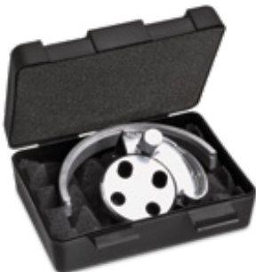
optibelt MT-A II