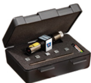
optibelt LASER POINTER II

Mit Sicherheit kennen Sie die Bedeutung einer korrekten Montage sowie einer regelmäßigen Kontrolle und Wartung von Keilriemen, Zahnriemen, Kraftbändern und Keilrippenriemen. Optibelt bietet Ihnen deshalb verschiedene nützliche und durchdachte Werkzeuge, die eine optimale Spannung und Ausrichtung gewährleisten und so für mehr Sicherheit und Effizienz sorgen – im Antrieb genau wie in der Anwendung. Denn alle Werkzeuge zeichnen sich durch eine besonders unkomplizierte Handhabung aus. Überzeugen Sie sich am besten selbst!