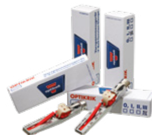
optibelt OPTIKRIK 0, I, II, III